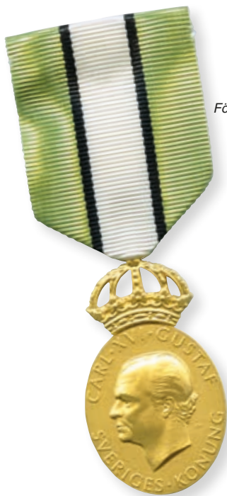
Förtjänstmedalj guld. En medalj i miniatyr medföljer.